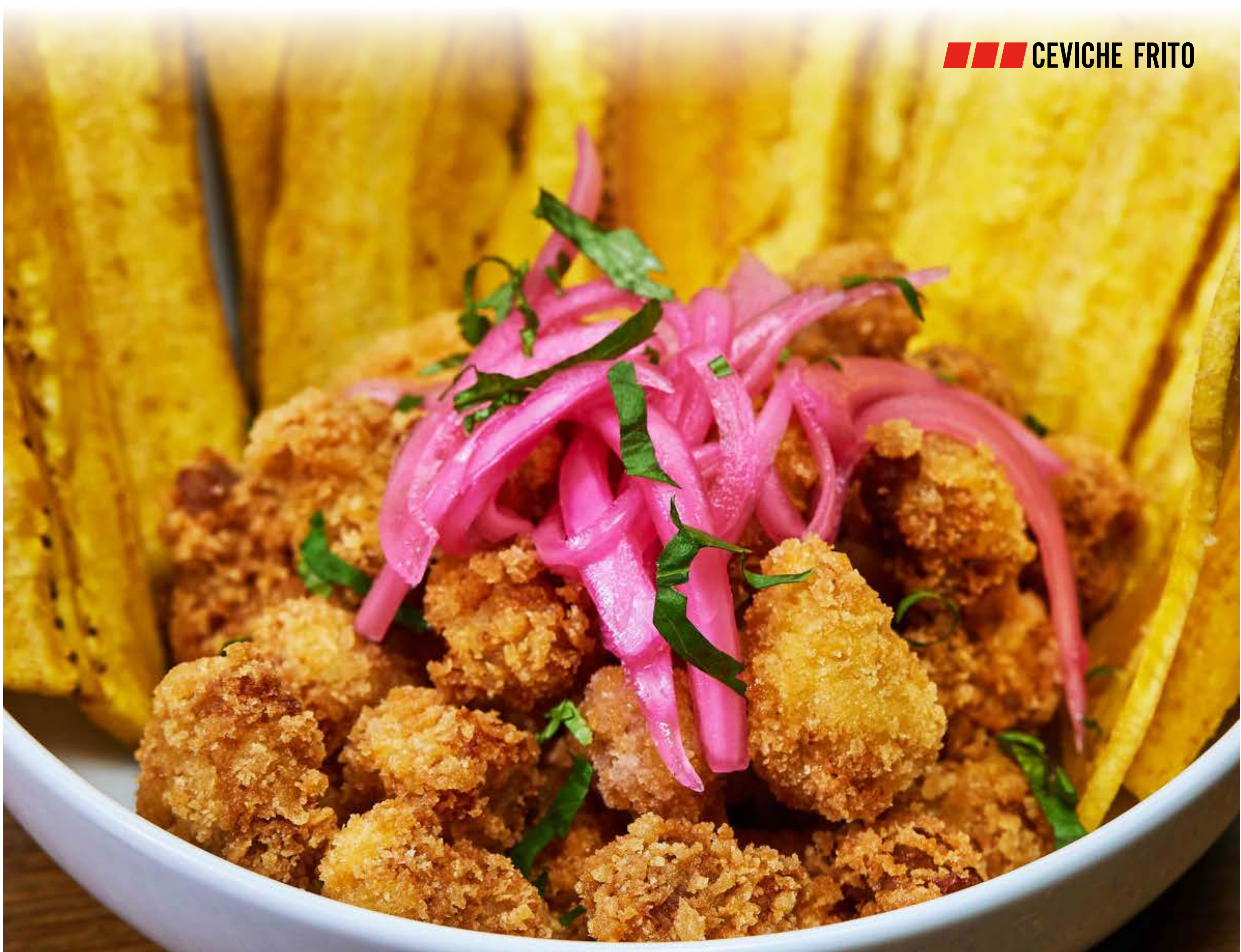
■■■■ CEVICHE FRITO